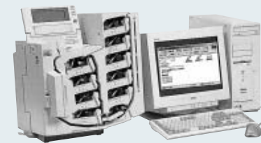
投票用紙読取分類機

衆議院選挙が11月9日に実施されました。 今回特に注目された商品は、投票用紙に書かれた手書き文字を高速で読み取り、仕分け分類する投票用紙読取分類機。従来の手作業を機械化することで大幅な事務効率化を実現しました。このほか、投票用紙計数機、交付機、開く投票用紙など幅広い分野でムサシの機器が全国で活躍。一刻も早く開票結果を知りたい有権者の皆様のために選挙をトータルサポートし、来年夏の参議院選挙に向けさらなる飛躍を目指します。